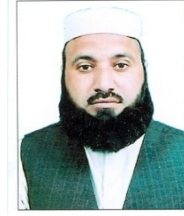
ڈاکٹر قاری عبدالرشید (تمغہ امتیاز)