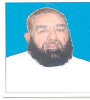
علامہ سید افتخار حسین نقوی