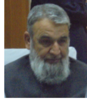
جسٹس (ریٹائرڈ) محمد رضا خان