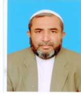
علامہ عارف حسین واحدی