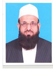
مولانا علی محمد بوتراب