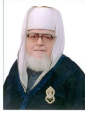
پیر روح الحسنین معین