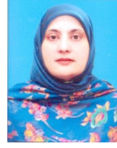
پروفیسر ڈاکٹر فرحتہ منصور ضیاء