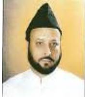
پروفیسر ڈاکٹر صاحبزادہ ساجد الرحمن