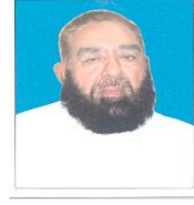
علامہ سید افتخار حسین نقوی