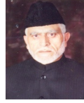
جسٹس (ریٹائرڈ) سید منظور حسین گیلانی (ممبر)